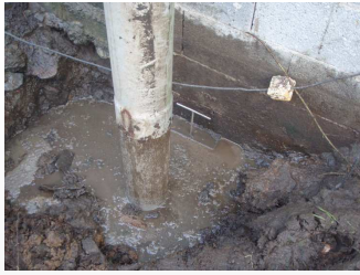
Vanne à l'origine de la pollution