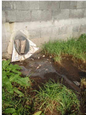
Fuite en sortie de gaine de ventilation (milieu du bâtiment voisin)