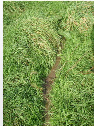
Ru pollué en contrebas